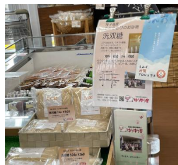
ゆうゆう舎に自主製品の 売り場を提供する 由比原藤商店

一方でプロジェクト立ち上げからずっと支援を続けてくれている企業もあることは、本当にありがたいことです。