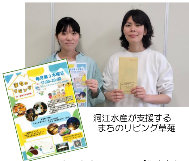
洞江水産が支援する まちのリビング草薺

企業や商店が扱う商品の売上の一部を市民活動団体に寄付をするという仕組みで企業・NPO・市民をつなげようという事業です。しかし、厳しい社会情勢の中、協力者を探すことの難しさを実感させられることもしばしばでした。